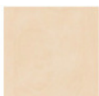
Mesteacăn Mainau H1733