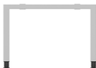
alb RAL 9010